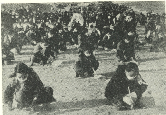
Fig. 3. Women organised into insect-catching teams to exterminate the insects dropped on the snowy ground by the American planes.