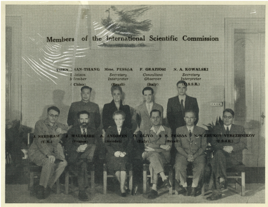
Bild 1: Kommissionens medlemmar.