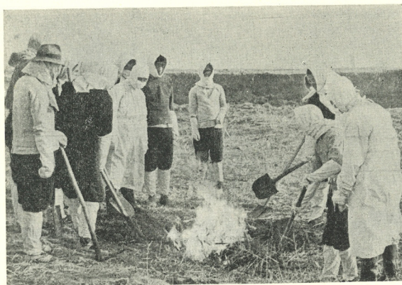
Fig. 4. Incineration and burial of the insects dropped from the American planes.

Bild 3: Bilder ur originalrapporten föreställandes Kinas hälsoinstituts verksamhet.